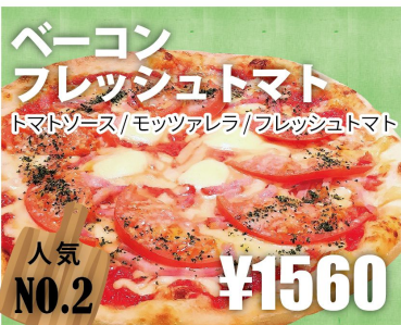
ベーコン フレッシュトマト トマトソース/モッツアレラ/フレッシュトマト 人気 NO.2 ¥1560