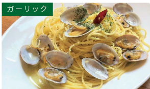
ガーリック ポンゴレビアンコ ¥1040