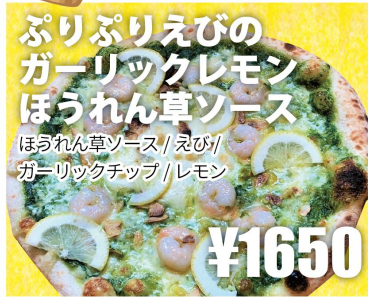
ぷりぷりえびの ガーリックレモン ほうれん草ソース ほうれん草ソース/えび/ ガーリックチップ/レモン ¥1650