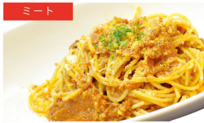
ミート ガーリックミートソース ¥1010