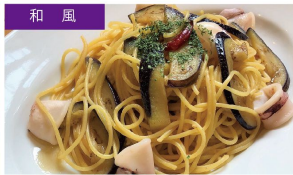
和風 やわらかいかとなすの こま醤油 ¥1090