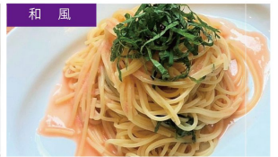
和風 たらこ青じそ ¥970