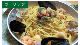
ガーリック 魚介ガーリック ¥1370