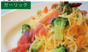
ガーリック イタリア産生ハムと ブロッコリーのペペロンチーノ ¥1190