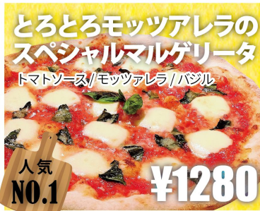
とろとろモッツアレラの スペシャルマルゲリータ トマトソース/モッツアレラ/バジル 人気 NO.1 ¥1280