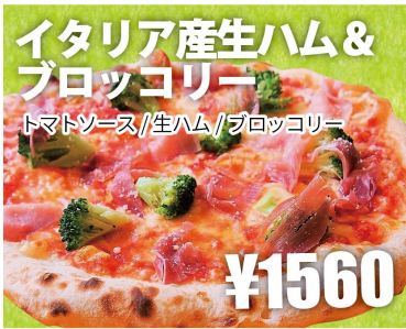
イタリア産生ハム& ブロッコリー トマトソース/生ハム/ブロッコリー ¥1560