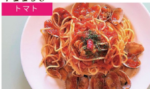
トマト ポンゴレロッソ ¥1080