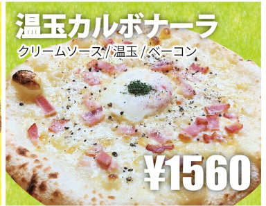
温玉カルボナーラ クリームソース/温玉/ベーコン ¥1560