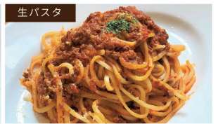
生パスタ 自家製甜麺醬の 味噌ミートソース生パスタ ¥1120