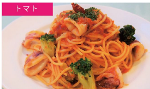
トマト やわらかいかとブロッコリー ¥1100