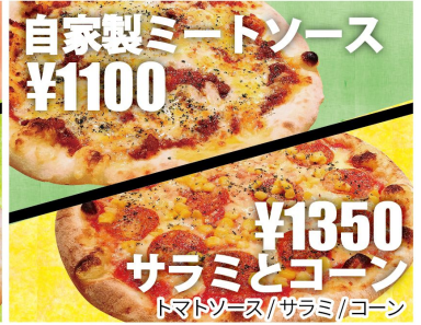
自家製ミートソース ¥1100 サラミとコーン トマトソース/サラミ/コーン ¥1350