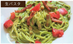
生パスタ ベーコンとフレッシュトマトの ほうれん草クリーム生パスタ ¥1200