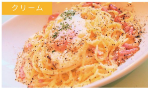
クリーム 温玉カルボナーラ ¥1050