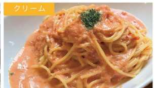
クリーム たらこのトマトクリーム ¥1190