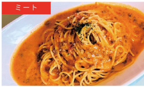
ミート ミートソースクリーム ¥1050