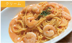
クリーム 小海老のトマトクリーム ¥1340