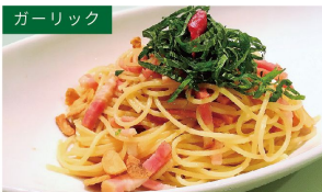
ガーリック ベーコンと青じそ ¥1030