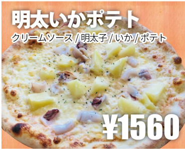
明太いかポテト クリームソース/明太子/いか/ポテト ¥1560