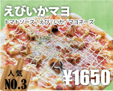
えびいかマヨ トマトソース/えび/いか/マヨネーズ 人気 NO.3 ¥1650