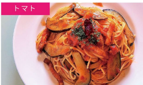
トマト ベーコンとなす ¥1080