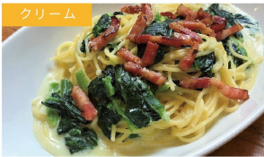
クリーム ベーコンとほうれん草 ¥1080