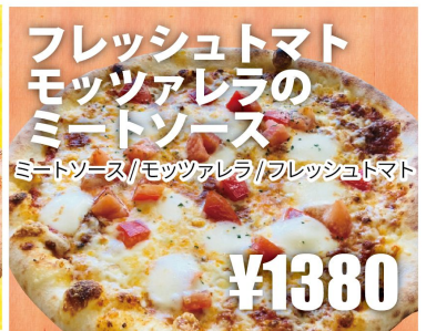
フレッシュトマト モッツアレラの ミートソース ミートソース/モッツアレラ/フレッシュトマト ¥1380