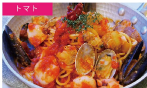
トマト ペスカトーレ ¥1450