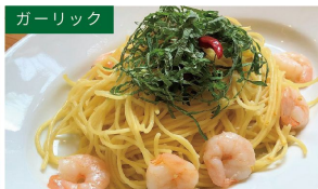
ガーリック 小海老と青じそ ¥1080