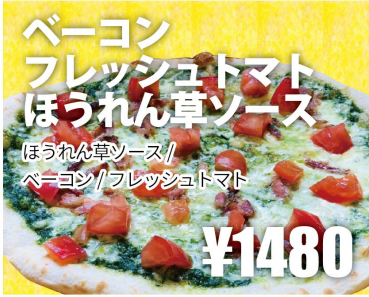
ベーコン フレッシュトマト ほうれん草ソース ほうれん草ソース/ ベーコン/フレッシュトマト ¥1480