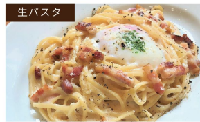
生パスタ 生パスタカルボナーラ ¥1160