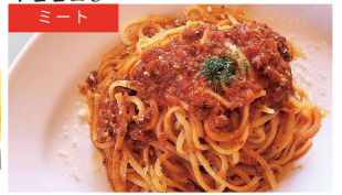
ミート 味噌ミートソース ¥1010