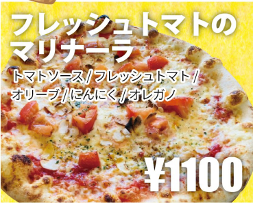
フレッシュトマトの マリナーラ トマトソース/フレッシュトマト/ オリーブ/にんにく/オレガノ ¥1100