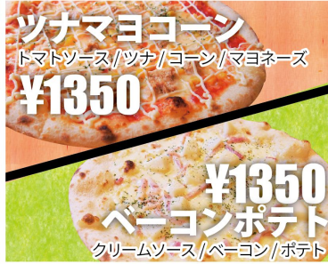
ツナマヨコーン トマトソース/ツナ/コーン/マヨネーズ ¥1350 ベーコンポテト クリームソース/ベーコン/ポテト ¥1350